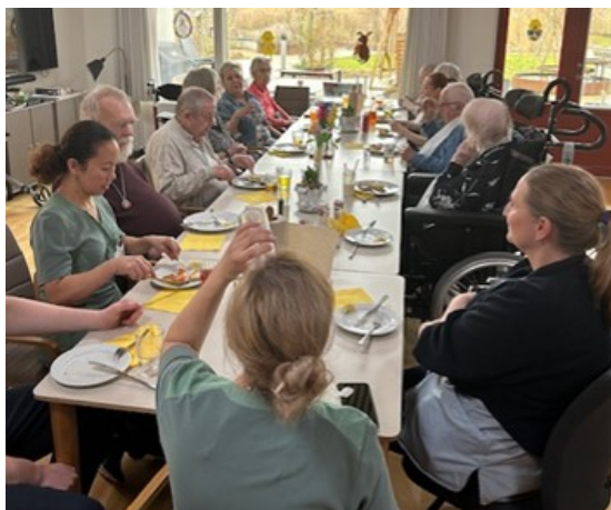
Påskefrokost i Skov- kvarteret